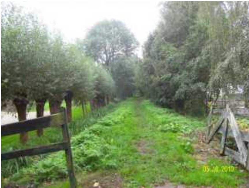
Hollandse Kade aan de oostzijde van Haanwijk

De Hollandse Kade aan de oostzijde en deels aan de zuidzijde van de polder Haanwijk is door de eeuwen heen onaangetast gebleven. Zowel historisch als landschappelijk is de Hollandse Kade naast Haanwijk een waardevol element in Harmelen.