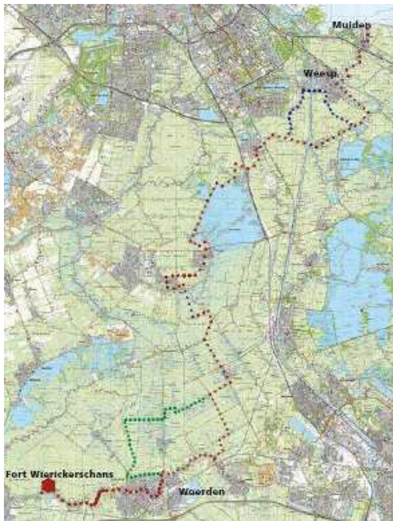
Landkaart met oude Hollandse Waterlinie

Er bestaat een relatie tussen Hollandse Kade en de oude Hollandse Waterlinie: