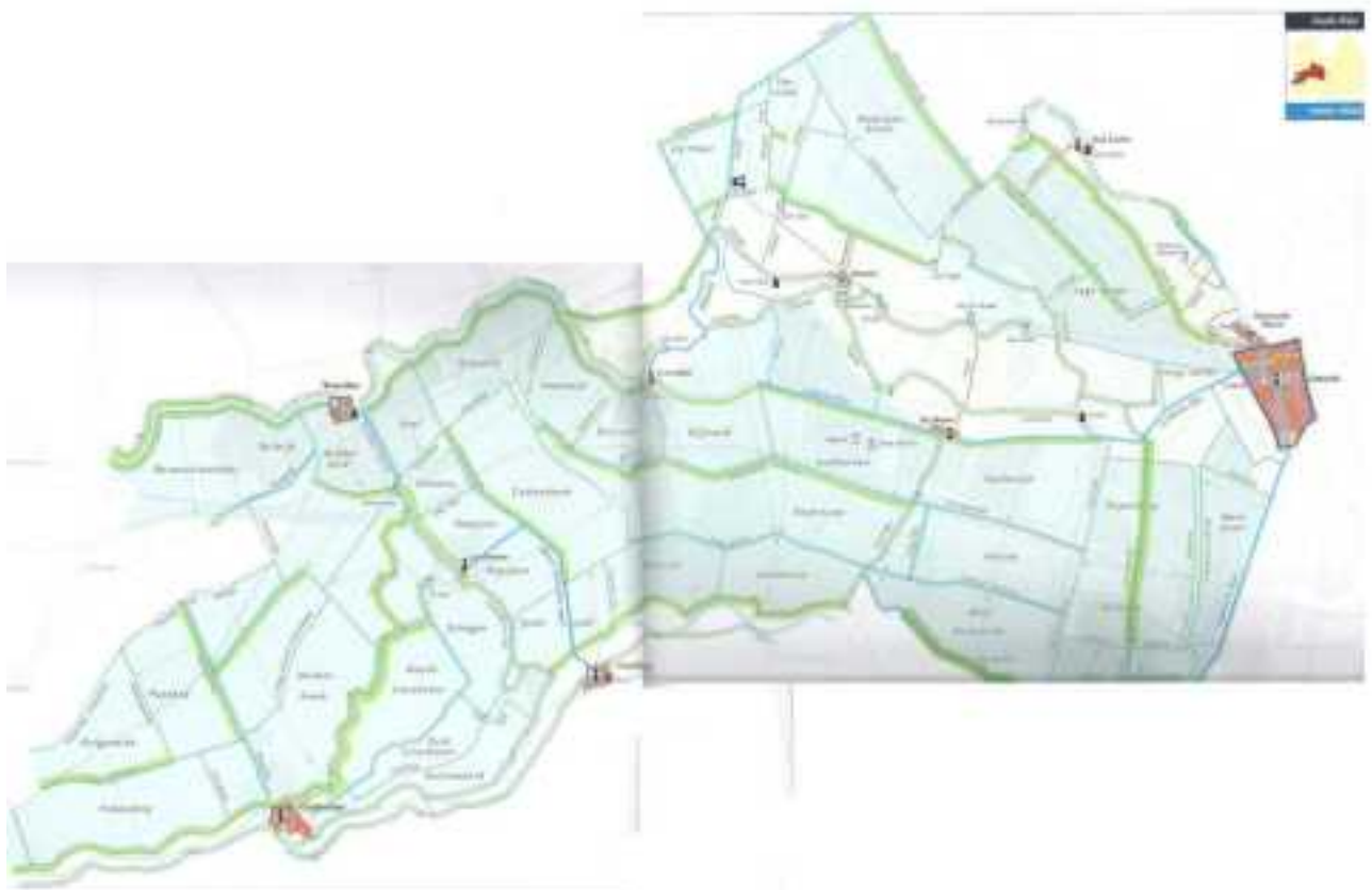
Ontginningsassen van polders ten zuiden van de Oude Rijn 1000-1600

Vanaf de tweede helft van de veertiende eeuw moesten windbemaling, bredere molenvlieten, extra weteringen en kaden zorgen voor het drooghouden van de ontginningen. Onder Harmelen kwamen niet minder dan vijf molenvlieten op de Oude Rijn uit.