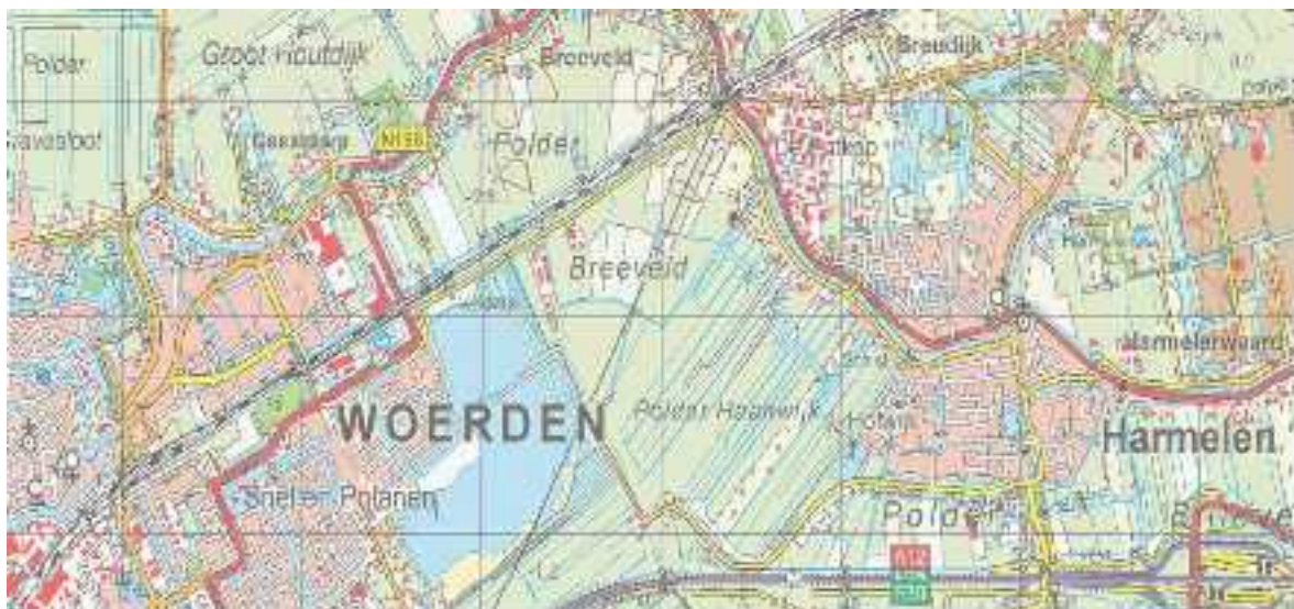
Polder Haanwijk tussen Woerden en Harmelen

De sluis in de Rijn bij de Hollandse Kade van Haanwijk dateert oorspronkelijk uit 1660 en kwam in plaats van de Haanwijkerdam. De Haanwijkerdam, Heldam en Stadsdam werden opgeworpen toen de Rijnmond verzand raakte en daardoor de afvoer van water via de Rijn werd belemmerd.