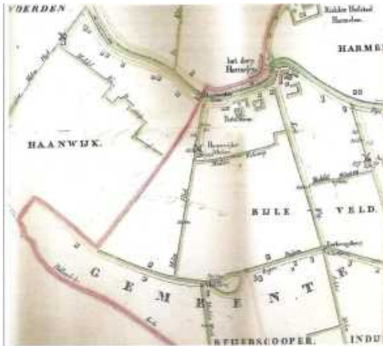
Hollandse Kade door Harmelen De locatie van de vroegere Haanwijker molen is weergegeven. (Kaartdeel van Waterschap Bijleveld, 1836)

De Hollandse Kade door het dorp Harmelen is de vroegere scheiding tussen het Groot Waterschap Woerden en het Groot Waterschap Bijleveld. Deze Hollandse Kade liep vanaf Ridder Hofstad Harmelen in het noorden langs Jonckheerelaan, Dorpsstraat, Haanwijker Sluis en de oostzijde van polder Haanwijk naar het zuiden.