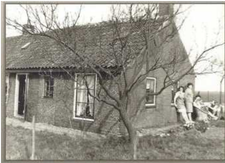
Daggeldershuisjes "De Kievit"

De daggeldershuisjes "De Kievit" zijn gebouwd in 1862. Oorspronkelijk stonden er vier huisjes op het terrein. De Oude Rijn ligt hier op ongeveer 300 meter afstand. Tijdens de oorlog 1940-1945 vond inundatie van de polder Haanwijk plaats waarna één van de huisjes wegens instorting moest worden gesloopt.